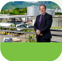
Alan Ganoo, Minister of Land Transport and Light Rail of Mauritius

« Face à un parc automobile en expansion et une demande accrue pour des véhicules sophistiqués, la technologie Shell V-Power incarne l'excellence en matière de performance et d'innovation. Son introduction sur le marché est en phase avec la vision du gouvernement d'une mobilité moderne et durable pour le pays. »